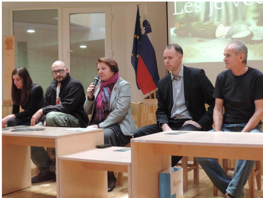
Tretji Festival lesa 2015